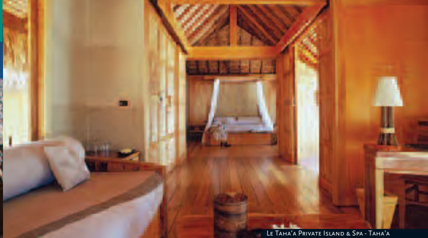
LE TAHA'A PRIVATE ISLAND & SPA - TAHA'A