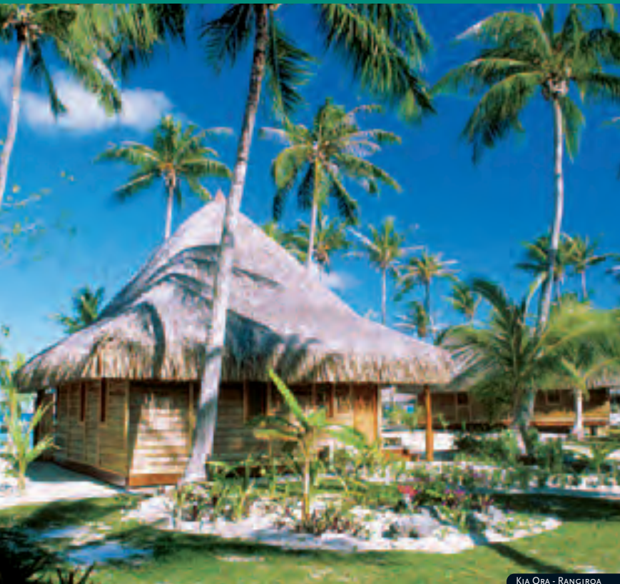
KIA ORA - RANGIROA