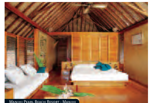
MANIHI PEARL BEACH RESORT - MANIHI