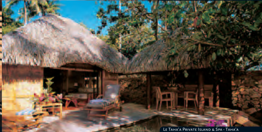
LE TAHA'A PRIVATE ISLAND & SPA - TAHA'A