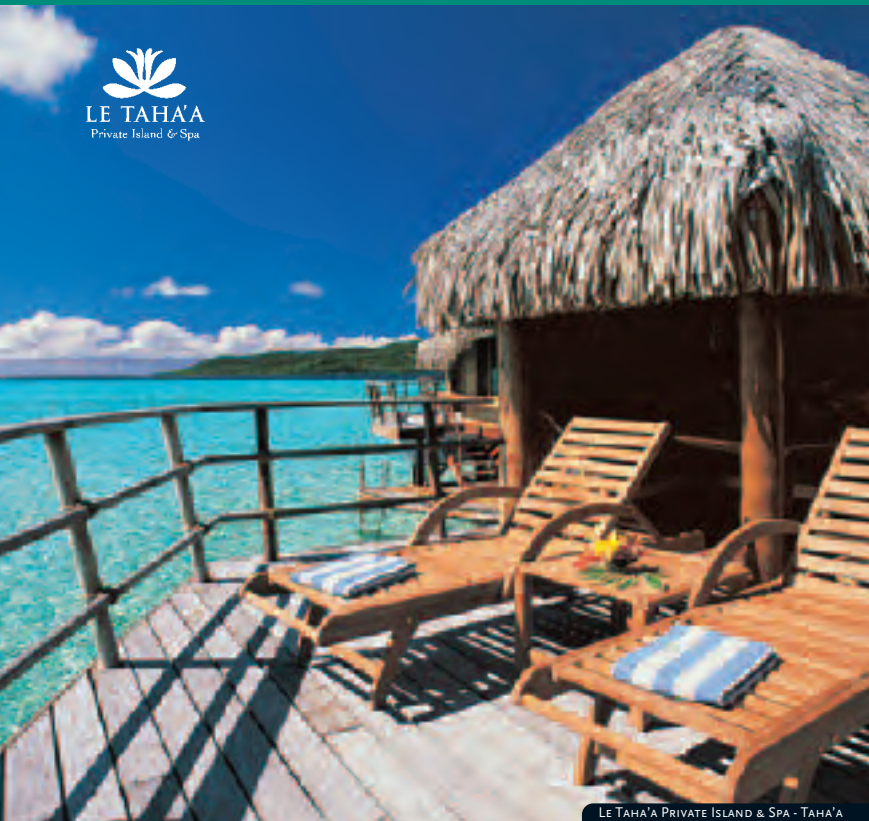
LE TAHA'A PRIVATE ISLAND & SPA - TAHA'A