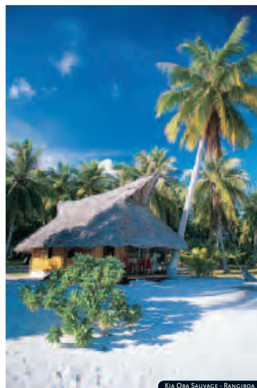
KIA ORA SAUVAGE - RANGIROA