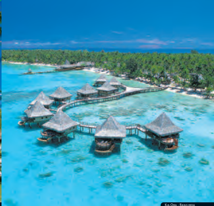
KIA ORA - RANGIROA