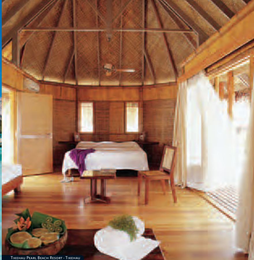
TIKEHAU PEARL BEACH RESORT - TIKEHAU