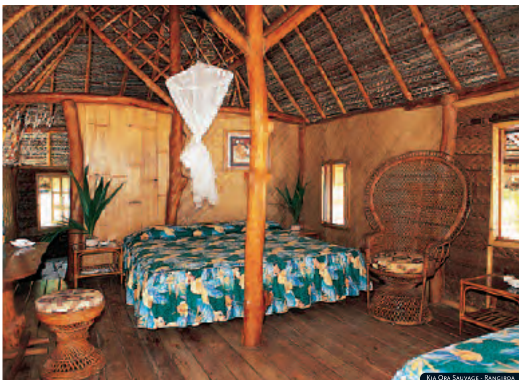
KIA ORA SAUVAGE - RANGIROA

A añadir al precio base del programa «Paraísos de Polinesia».