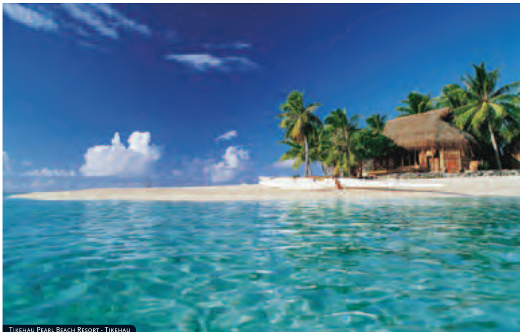
TIKEHAU PEARL BEACH RESORT - TIKEHAU

A 10 min. de Rangiroa, en la isla menos conocida del archipiélago: Tikehau. Este hotel, el único del atolón, está muy cerca del aeropuerto y del pueblo de Tuherahera. Su reducida capacidad y su entorno sublime lo convierten en un hotel acogedor y único. Cuenta con 14 bungalows en la playa y 24 bungalows sobre pilares. Todos disponen de secador, ventilador y climatizador, teléfono, mini-bar, caja fuerte, televisor y cafetera. El resort ofrece restaurante, bar, tienda, servicio de habitaciones, conjunto de música local, piscinas, y la posibilidad de practicar deportes (submarinismo, piraguas) o de participar en alguna de las actividades culturales y salidas que el resort organiza: barco para ir a Tuherahera, pesca de altura y cruceros a la puesta del sol.