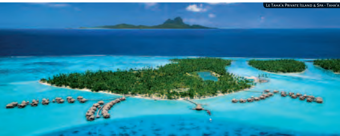
LE TAHA'A PRIVATE ISLAND & SPA - TAHA'A