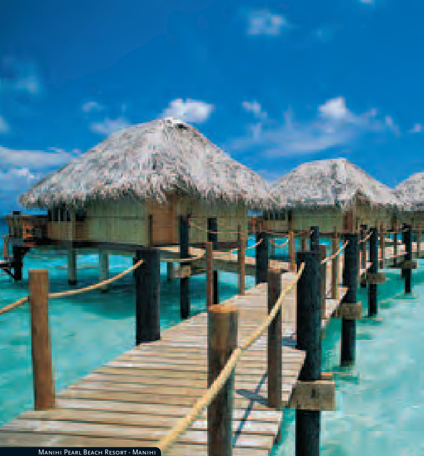
MANIHI PEARL BEACH RESORT - MANIHI