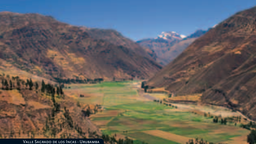
VALLE SAGRADO DE LOS INCAS - URUBAMBA