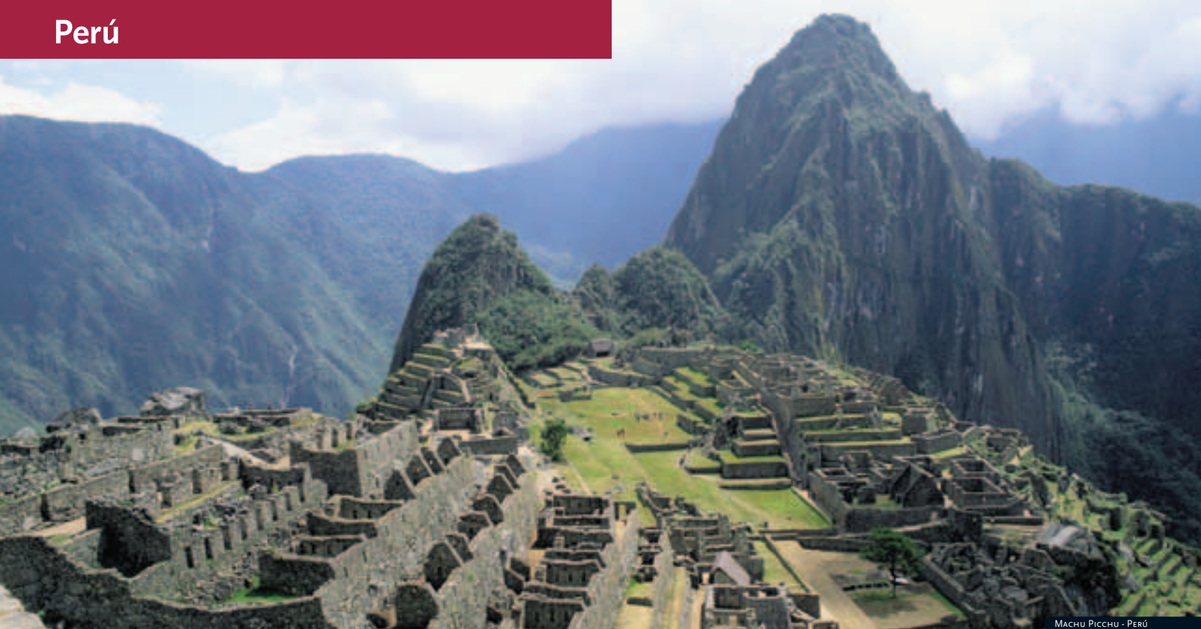
MACHU PICCHU - PERÚ