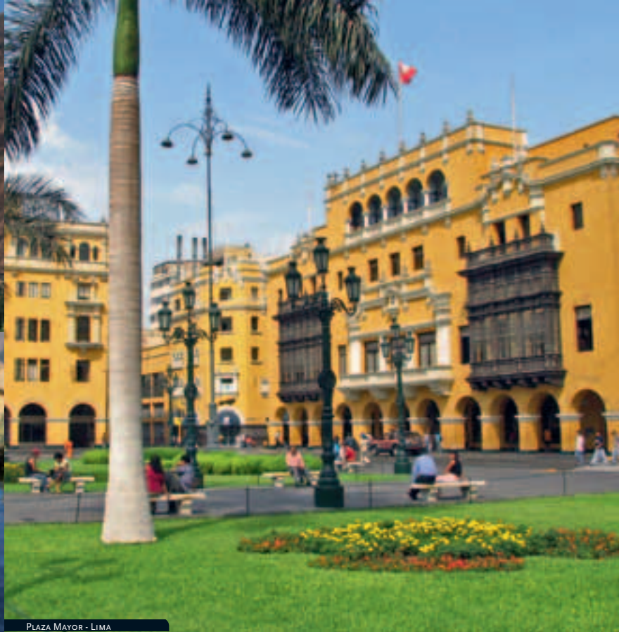
PLAZA MAYOR - LIMA

tren y autobús a la ciudad de Cuzco. Traslado al hotel y alojamiento.