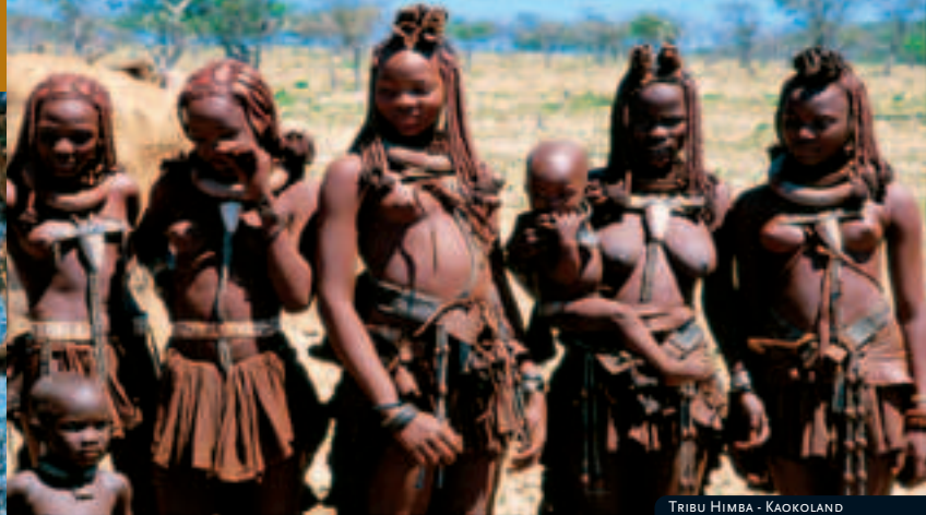
TRIBU HIMBA - KAOKOLAND