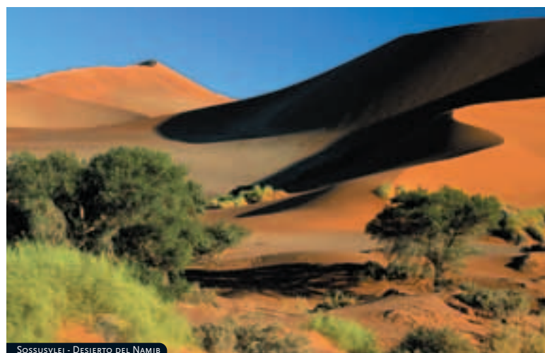
SOSSUSVLEI - DESIERTO DEL NAMIB

Situado al sur de Windhoek, a sólo 5 minutos en coche del centro de la ciudad. Su estilo victoriano delata el origen histórico de este establecimiento, antigua estación ferroviaria de Windhoek. Cuenta con 90 habitaciones y suites totalmente equipadas y también de estilo victoriano. Ofrece una completa variedad gastronómica en sus dos restaurantes y forma parte de un exclusivo Club de Golf cercano.