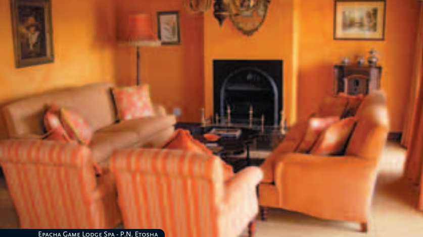
EPACHA GAME LODGE SPA - P.N. ETOSHA