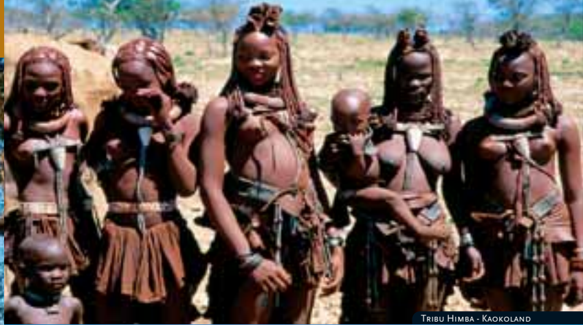
TRIBU HIMBA - KAOKOLAND