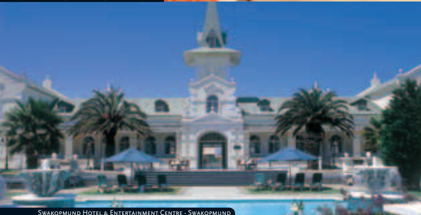
SWAKOPMUND HOTEL & ENTERTAINMENT CENTRE - SWAKOPMUND