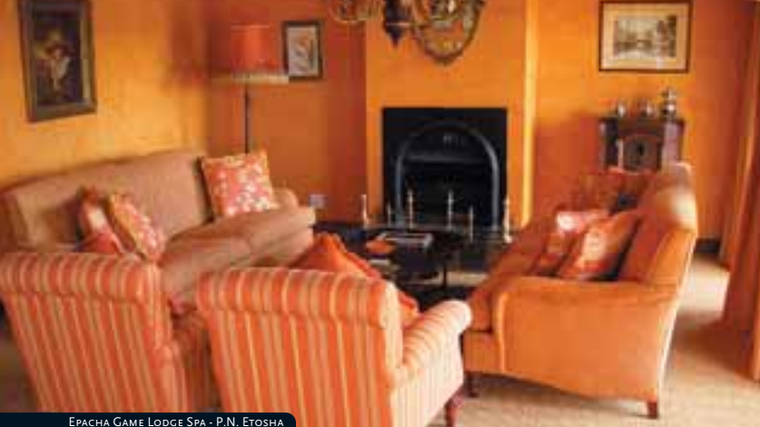
EPACHA GAME LODGE SPA - P.N. ETOSHA