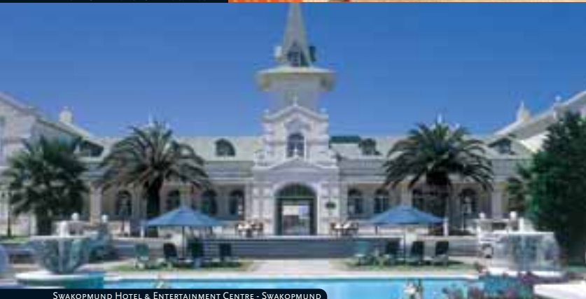
SWAKOPMUND HOTEL & ENTERTAINMENT CENTRE - SWAKOPMUND

za del lugar. Posibilidad de hacer excursiones opcionales con ranger en vehículos de 4x4. Cena y alojamiento.