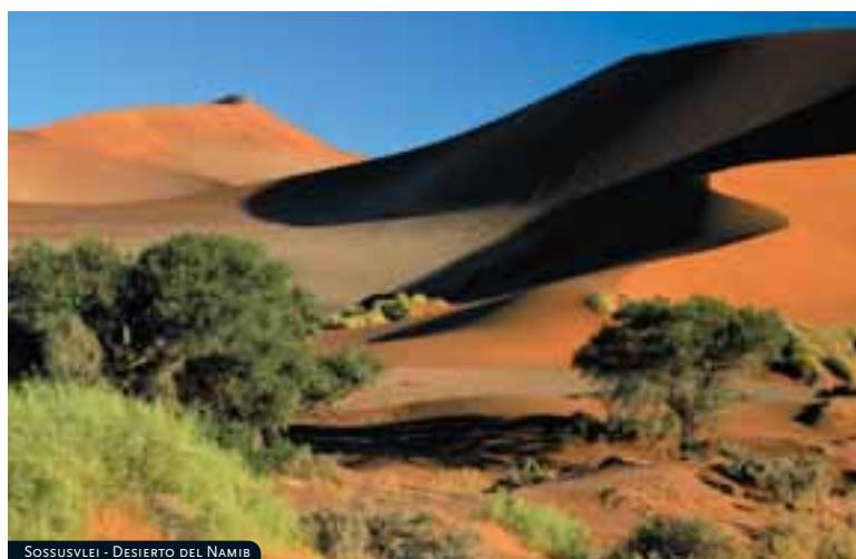
SOSSUSVLEI - DESIERTO DEL NAMIB

Situado al sur de Windhoek, a sólo 5 minutos en coche del centro de la ciudad. Su estilo victoriano delata el origen histórico de este establecimiento, antigua estación ferroviaria de Windhoek. Cuenta con 90 habitaciones y suites totalmente equipadas y también de estilo victoriano. Ofrece una completa variedad gastronómica en sus dos restaurantes y forma parte de un exclusivo Club de Golf cercano.