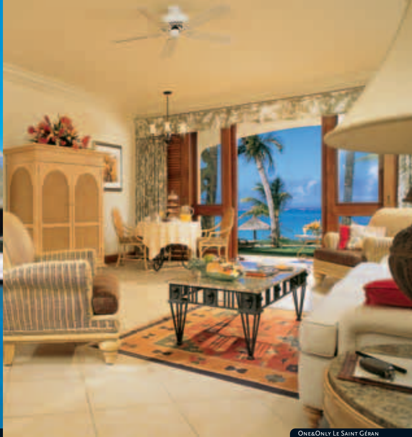
ONE&ONLY LE SAINT GÉRAN