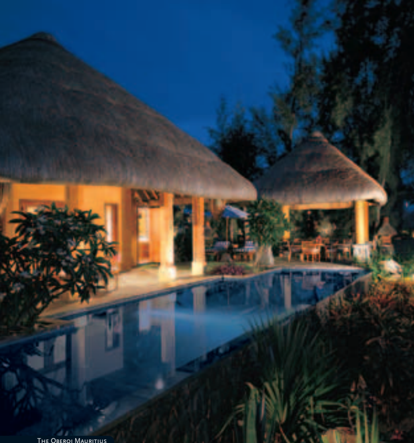
THE OBEROI MAURITIUS