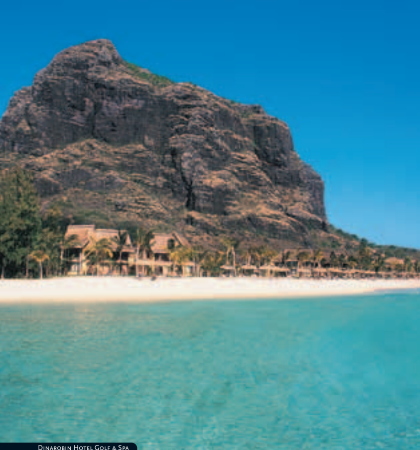
DINAROBIN HOTEL GOLF & SPA