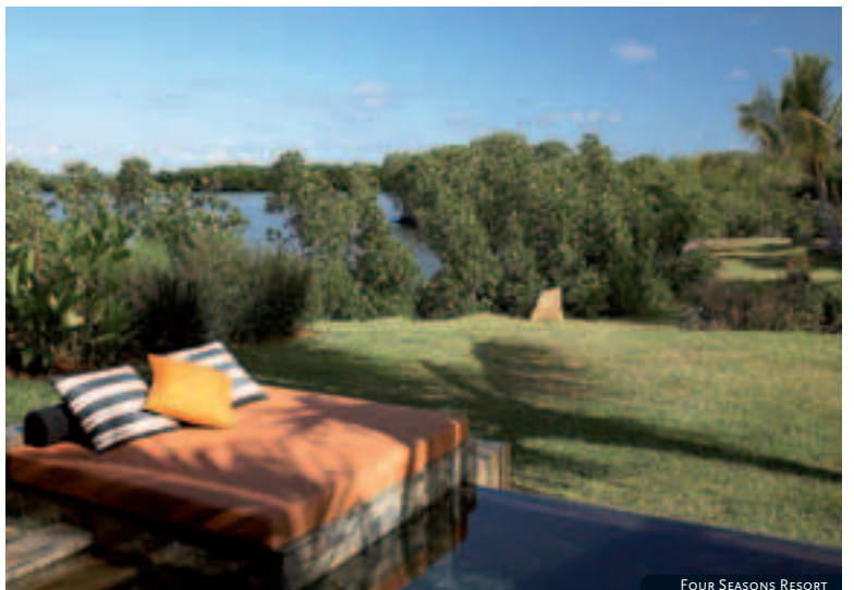
FOUR SEASONS RESORT