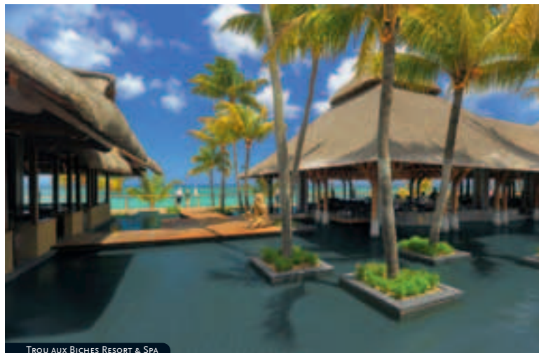
TROU AUX BICHES RESORT & SPA

MP: Media pensión (desayuno-buffet y cena)