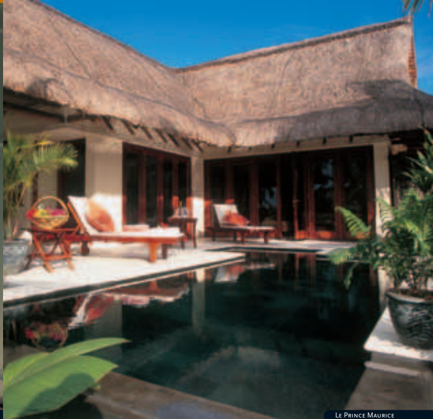
LE PRINCE MAURICE